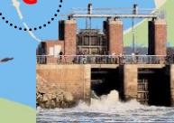
Ecluses du Crotoy